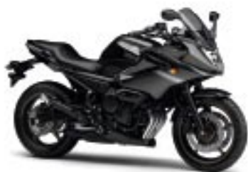
XJ6 Diversion/ABS – Graphite (DNMG)