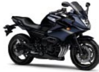
XJ6 Diversion/ABS – Ocean Depth (DPBMU)

Aby zwiększyć funkcjonalność, oba motocykle oferujemy z wytrzymałym bagażnikiem tylnym, dużym (46-litrowym) kufrem oraz z oparciem dla pasażera, które zapewnia mu wygodniejszą pozycję podczas jazdy. W celu jak najlepszej ochrony motorów przed uszkodzeniami są one wyposażone w osłony cylindrów oraz silnika. Dodatkowo w wyposażeniu modelu XJ6 Diversion znajduje się rozkładany ekran, a model XJ6 może opcjonalnie zostać wyposażony w centralną stopkę. Sprawdź dostępność obu modeli u najbliższego dealera firmy Yamaha lub odwiedź stronę www.yamaha-motor.pl