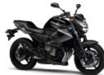
XJ6/ABS – Midnight Black (SMX)