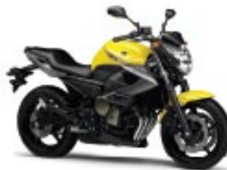
XJ6/ABS – Extreme Yellow (RYC1)