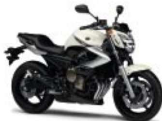
XJ6/ABS – Cloudy White (NPW)