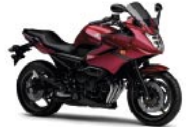
XJ6 Diversion/ABS – Lava Red (DRMK)