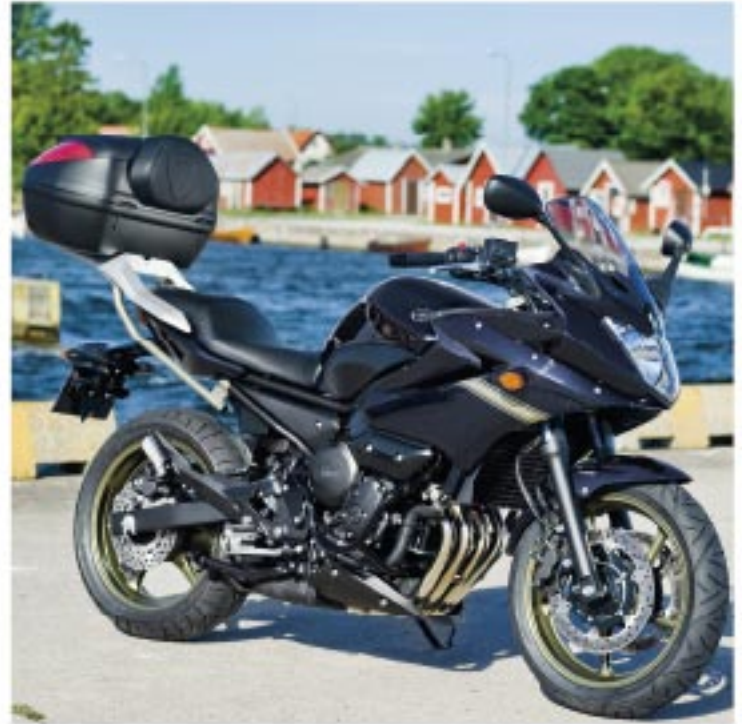
XJ6 Diversion ABS wyposażony w oryginalne akcesoria Yamaha