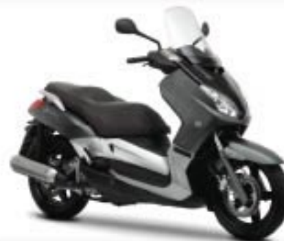
Aluminum Slate (MNM2)