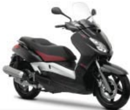
BLACK X-MAX (MSM1)