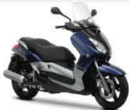
Thunder Blue (DPBMX)