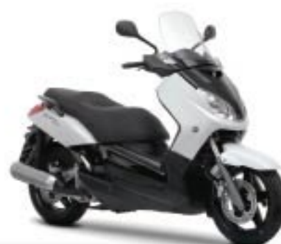
Competition White (BWC1)