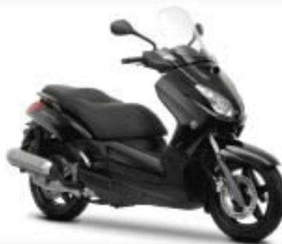
Midnight Black (SMX)