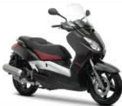
BLACK X-MAX (MSM1)

Poznaj nową, niezwykłą wersję skutera X-MAX: BLACK X-MAX — z niepowtarzalną, matowoczną karoserią z czerwonymi akcentami i wstawkami z włókna węglowego oraz dynamicznie wyglądającymi elementami graficznymi na owiewce i kołach.