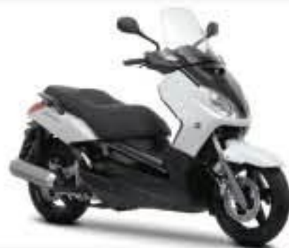
Competition White (BWC1)