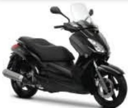
Midnight Black (SMX)